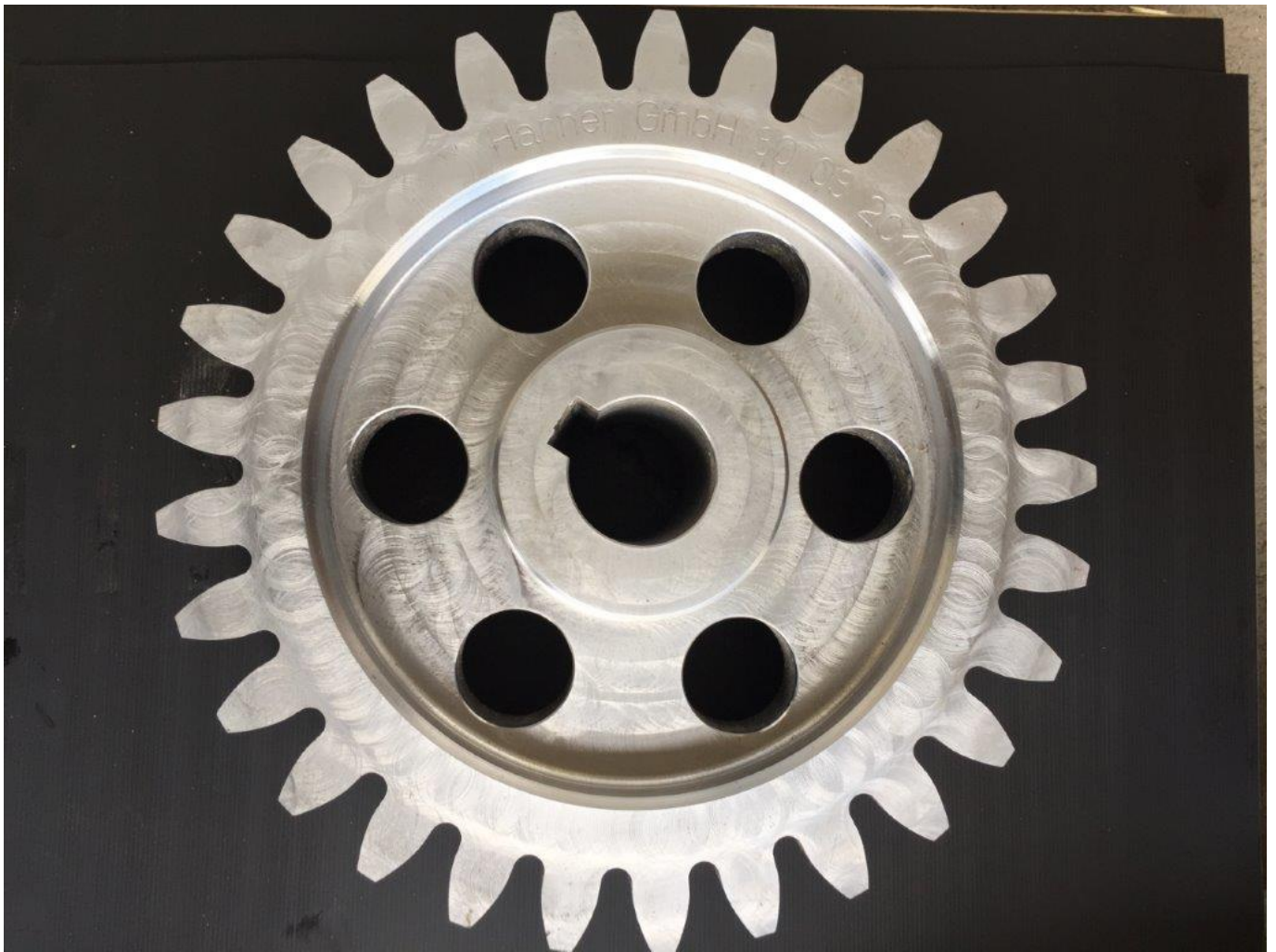
Zahnrad modul 16 / z 29 Dicke 155mm