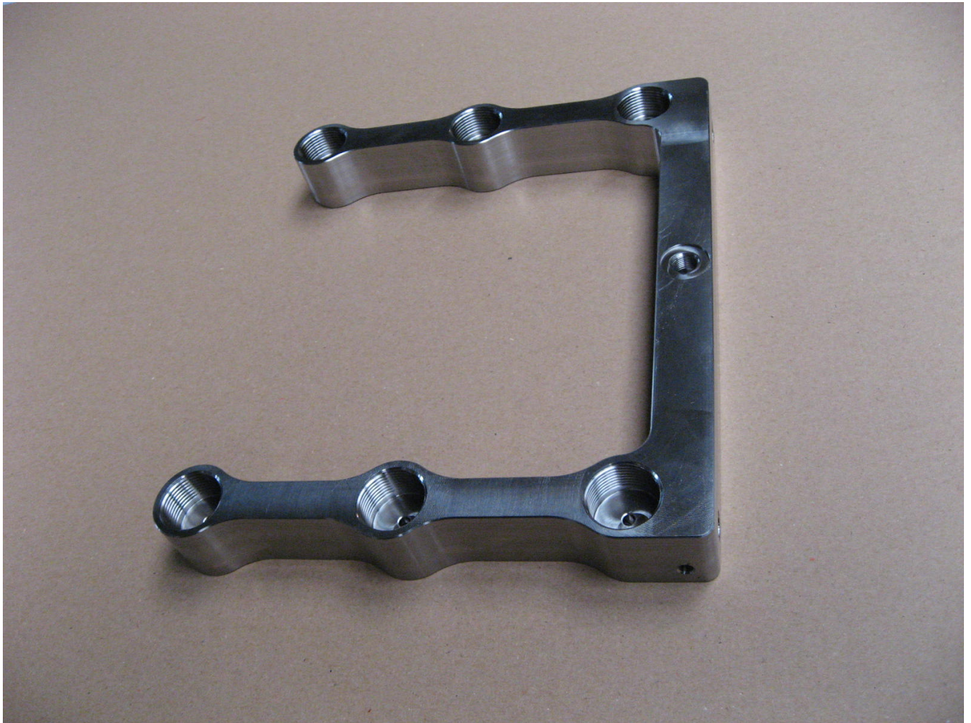
Sprühdüse aus Niro 1.4301, Bohrungen Durchmesser 3mm 250mm tief